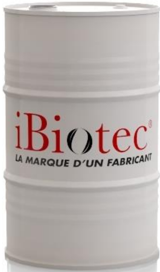
200 L varil